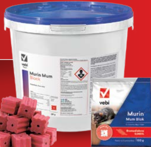
Murin Mum Blok