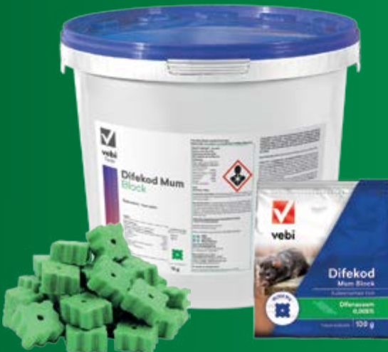
Difekod Mum Blok